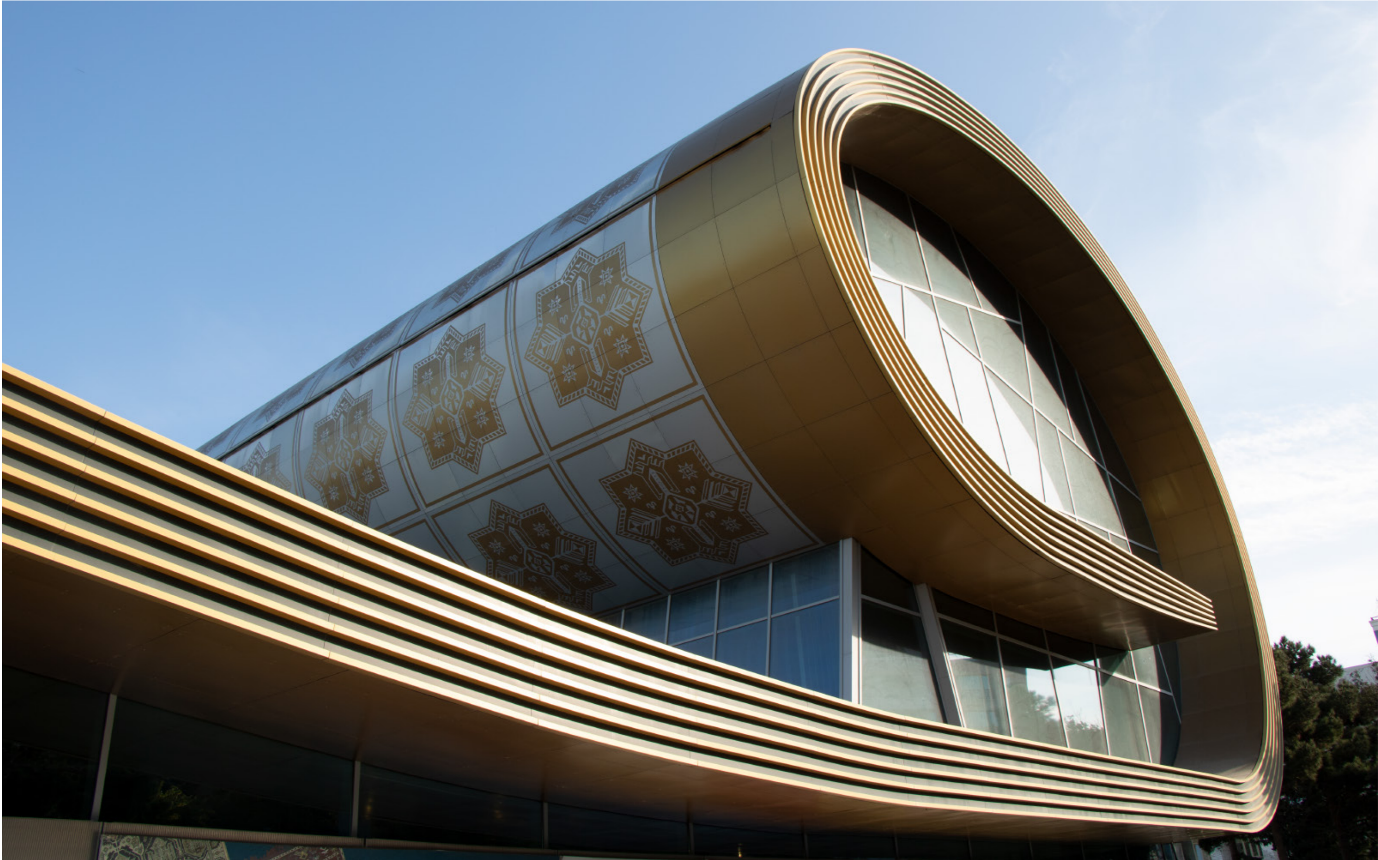
Bakıdaki Xalça Muzeyi.