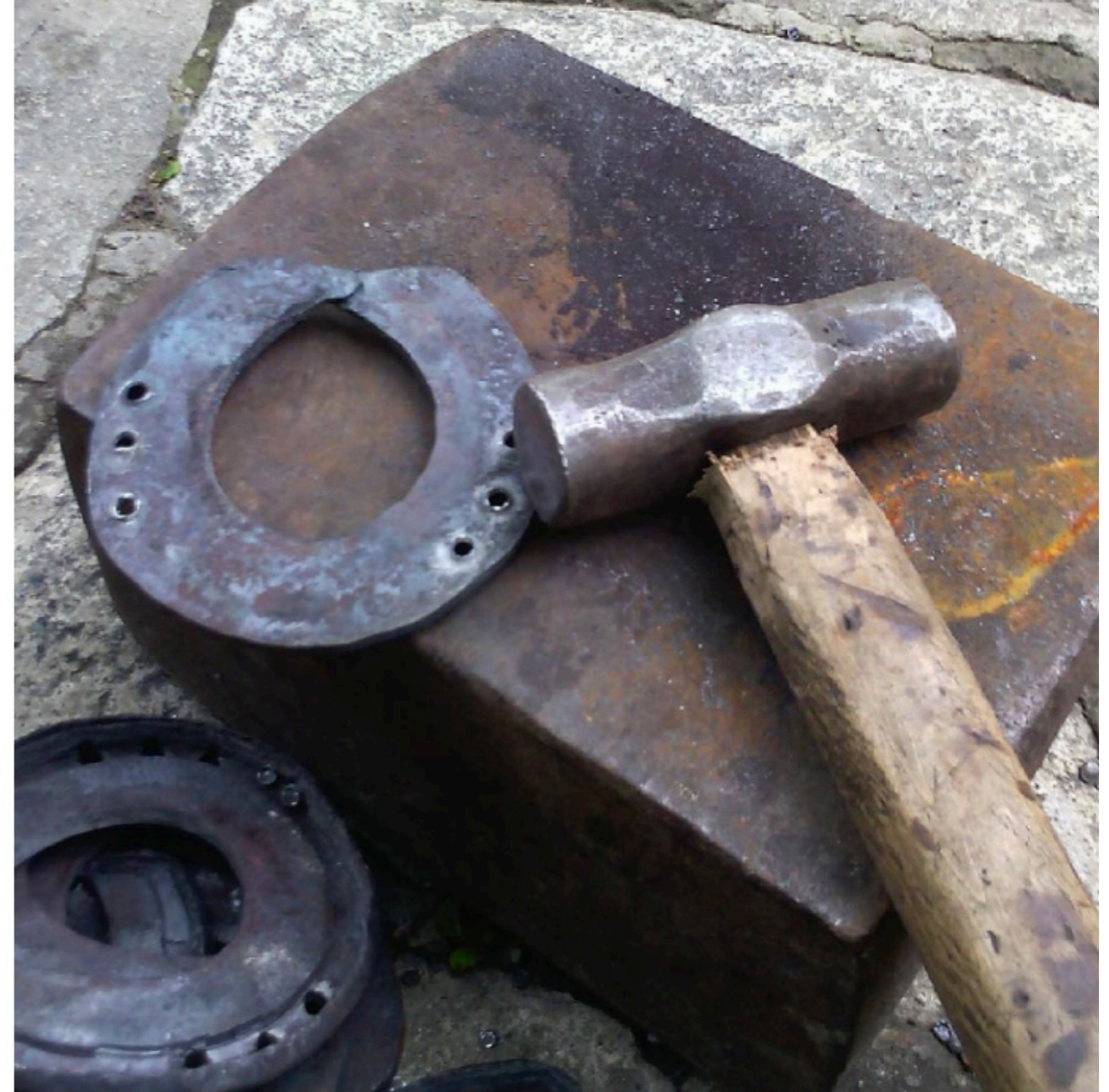
Fəzail Allahverdiyevin Lahıcdakı emalatxanasında çəkic.

etdi. Ümid edirik ki, işimiz regionda sənətkarlıq təcrübəsini zənginləşdirəcək və tədqiqat potensialını artıracaq.